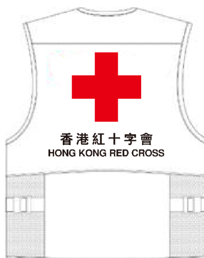
圖二：義工背心 (緊急)